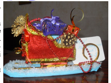
Редколегія 8-А кл.

У школі стало традицією проводити новорічну виставку зимових композицій. І цей рік не став винятком. Виставка здивувала учнів школи різноманітним виробом на тему: "Новорічний подарунок". Яких ялинок тут тільки не було: ялинка з макаронів, із цукерок, гудзиків, ниток, паперу. Всі класи, що взяли участь, доклали чимало зусиль для створення чудових композицій. Найкращі композиції були обрані судьями оргкомітету: це роботи 5-А, 6-Б, 8-А класів. Але дуже прикро, що не всі класи взяли участь в цій чудовій виставці.